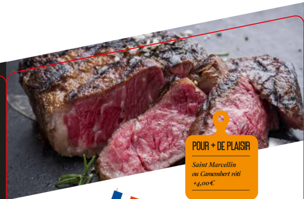
POUR + DE PLAISIR Saint Marcellin ou Camembert rôti +4,00 €