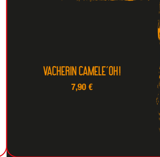
VACHERIN CAMELE'OH! 7,90 €