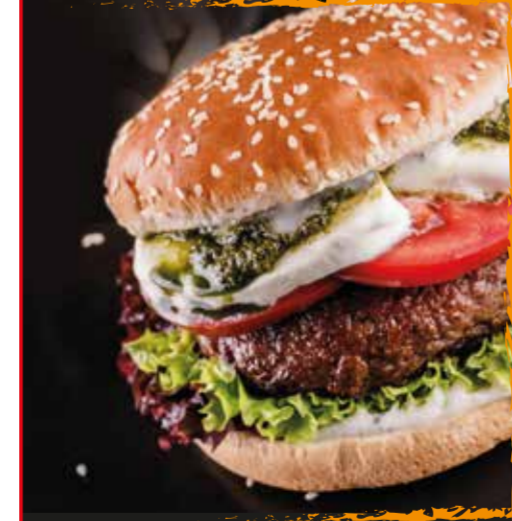
BURGER ITALIAN'OH! 17,50 €