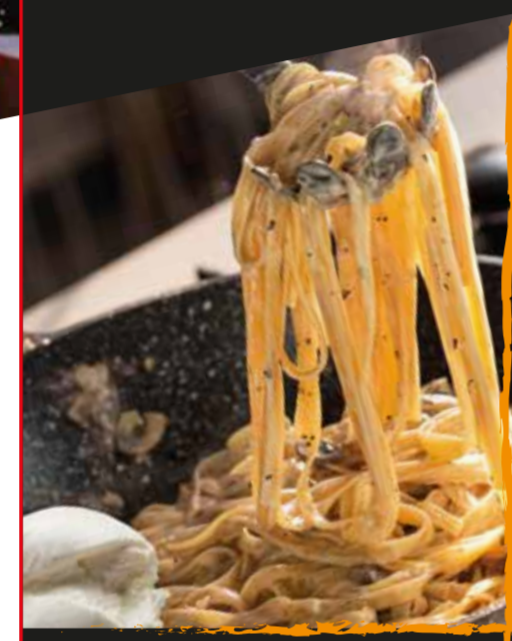
TAGLIATELLES SAUCE TRUFFÉE BURRATA 18,50 €