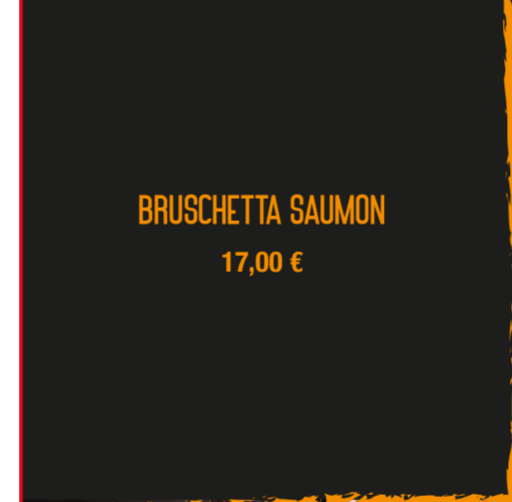
BRUSCHETTA SAUMON 17,00 €